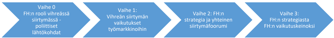
Kuvio 1. Hankkeen eri vaiheet

FOA on mukana työryhmässä, jonka tehtävänä on kehittää ja konkretisoida strategiaa helmi–maaliskuun 2020 aikana.