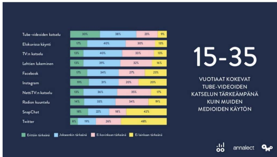
Kuva & lähde: Töttörö, Sisällöt ja vaikuttavuus Tubessa 2017, http://tottoroo.fi/svt-2017/ (N=2000, 15-35-v.)